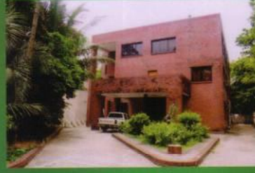
৩য় তল মাদারিক কেন্দ্র, বাউবি