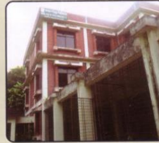
আঞ্চলিক কেন্দ্র যশোর পোস্ট : উপশহর, জেলা : যশোর ফোন : ০৪২১-৬৮৫২৬