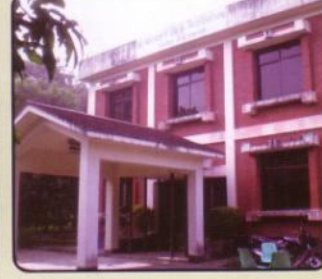
আঞ্চলিক কেন্দ্র রাজশাহী নওহাটা, পবা, রাজশাহী ফোন : ০৭২১-৮০০০০৮