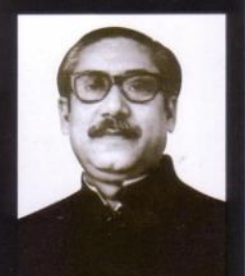
জাতীয় শোক দিবসে আলোচনা সভা