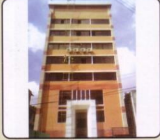
আঞ্চলিক কেন্দ্র ঢাকা ৪/খ, সরকারী ল্যাবরেটরী রোড, ধানমন্ডি, ঢাকা-১০৫ ফোন : (০২) ৯৬৭০৬৬৯, ফ্যাক্স : ৮৮-০২-৮৬১১০৬৫