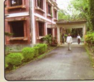
আঞ্চলিক কেন্দ্র বরিশাল হাউজিং এস্টেট, রূপাতলী, বরিশাল ফোন : ০৪৩১-২১৭৬২৮২