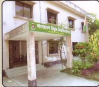
আঞ্চলিক কেন্দ্র খুলনা রোশনীবাগ, পোস্ট : খুলনা বিশ্ববিদ্যালয়, খুলনা। ফোন : ০৪১-৭৩১৭৯৫