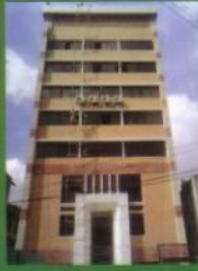
১ম তল মাদারিক কেন্দ্র, বাউবি