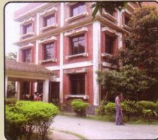
আঞ্চলিক কেন্দ্র রংপুর কেন্দ্রীয় বাস টার্মিনালের পাশে, বংপুর ফোন : ০৫২১-৬৩৫৯৩