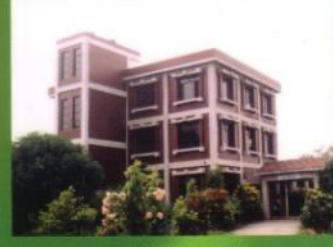
৬তম তল মাদারিক কেন্দ্র, বাউবি