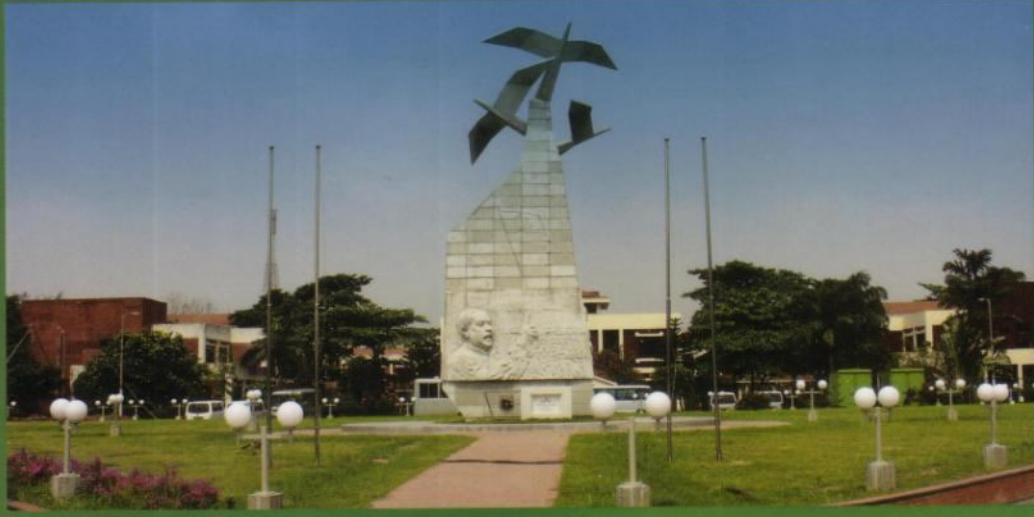
বাংলাদেশ উন্মুক্ত বিশ্ববিদ্যালয়ের মূল ক্যাম্পাস