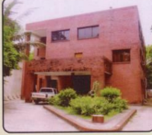
আঞ্চলিক কেন্দ্র চট্টগ্রাম সি আর বি রোড, চট্টগ্রাম। ফোন : ০৩১-৬১৯৬৩৩