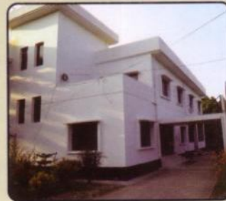
আঞ্চলিক কেন্দ্র ফরিদপুর হারোকান্দি, ফরিদপুর ফোন : ০৬৩১-৬২০৮১