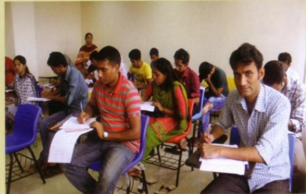
ঢাকা আঞ্চলিক কেন্দ্রে বিশ্ববিদ্যালয় পরিচালিত ৪ বছর মেয়াদী অনার্স প্রোগ্রামের শিক্ষার্থীগণ পরীক্ষায় অংশ নিচ্ছে।