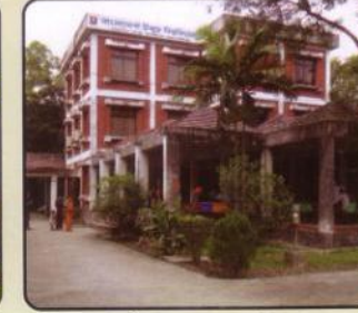
আঞ্চলিক কেন্দ্র ময়মনসিংহ মাসকানদা, ময়মনসিংহ। ফোন : ০৯১-৬৫২৯৮