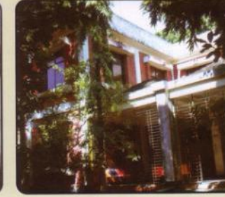
আঞ্চলিক কেন্দ্র কুমিল্লা দুর্গাপুর, কুমিল্লা ফোন : ০৮১-৭৭৫৫৭