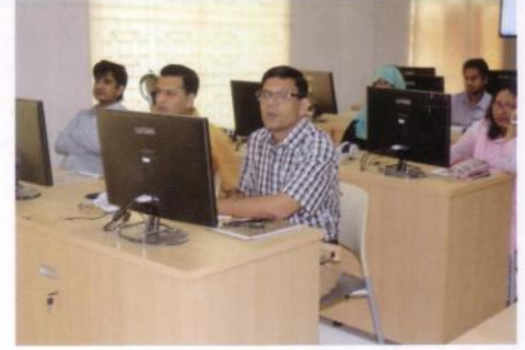
বিশ্ববিদ্যালয়ের শিক্ষকদের জন্য ODL ট্রেনিং প্রোগ্রামে ট্রেনিং সেশনে অংশগ্রহণকারী শিক্ষকদের একাংশ।