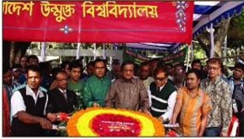
১৬ ডিসেম্বর মহান বিজয় দিবস উপলক্ষে উপাচার্যের নেতৃত্বে প্রো-উপাচার্য ও বাউবির শিক্ষক, কর্মকর্তা, কর্মচারীগণ সাতারে জাতীয় স্মৃতিসৌধে পুষ্পমাল্য অর্পণ করে শ্রদ্ধা নিবেদন করেন।