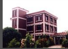
১২তম তলার কার্যালয়, বাউবি

প্রাক্তন পরিচিতি : বাংলাদেশ উন্মুক্ত বিশ্ববিদ্যালয় পাজীপুর ক্যাম্পাসে নির্মিতব্য মূল ফটকের ডিজাইন, মহান মুক্তিযুদ্ধের স্মারক ভাস্কর্য "বাধীনতা তিরস্তম্ভ"।