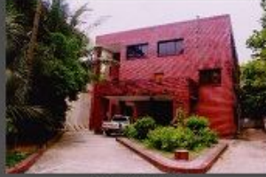
১১তম তলার কার্যালয়, বাউবি