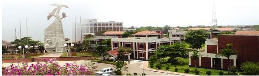
গাজীপুরে বিশ্ববিদ্যালয়ে নয়নাভিরাম মূল ক্যাম্পাস