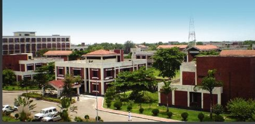
বাংলাদেশ উন্মুক্ত বিশ্ববিদ্যালয়ের মূল ক্যাম্পাস