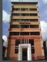
১০তম তলার কার্যালয়, বাউবি