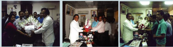
নব নিযুক্ত উপাচার্য মহোদয়কে বাউবি'র শিক্ষক, কর্মকর্তা ও কর্মচারীবৃন্দের ফুলেল শুভেচ্ছা জ্ঞাপন।