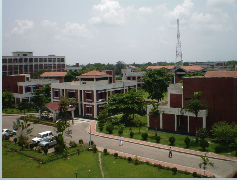
বাংলাদেশ উন্মুক্ত বিশ্ববিদ্যালয়ের মূল ক্যাম্পাস