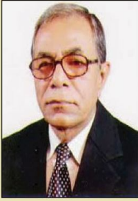
মোঃ আবদুল হামিদ মহামান্য রাষ্ট্রপতি গণপ্রজাতন্ত্রী বাংলাদেশ